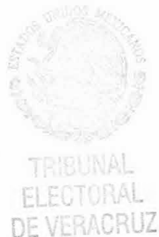
LAURA STIVALET PAVÓN