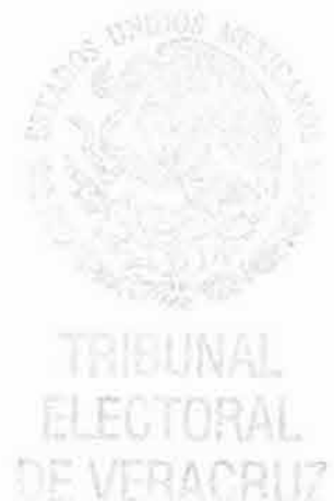
LAURA STIVALET PAVÓN