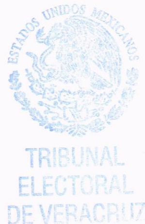
LAURA STIVALET PAVÓN