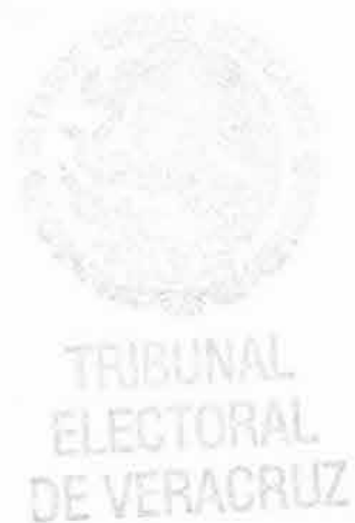
LAURA STIVALET PAVÓN