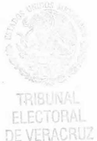
LAURA STIVALET PAVÓN