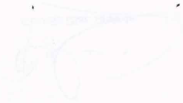
A short line of text or a label located directly below the diagram.

A line of faint text or a subtitle positioned above the main diagram.